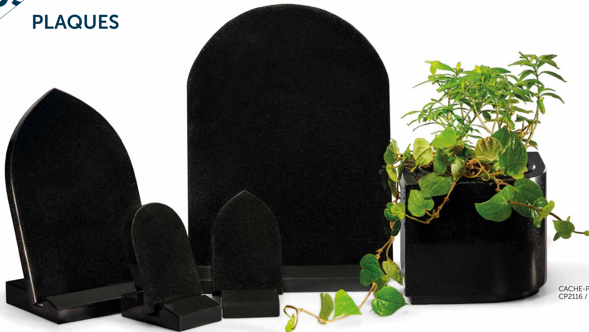
CACHE-POT CP2116 / P28