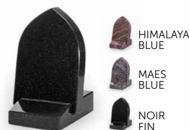
HIMALAYA BLUE MAES BLUE NOIR FIN