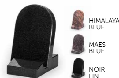
HIMALAYA BLUE MAES BLUE NOIR FIN