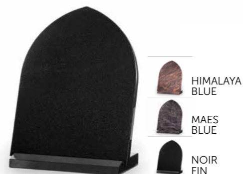
HIMALAYA BLUE MAES BLUE NOIR FIN