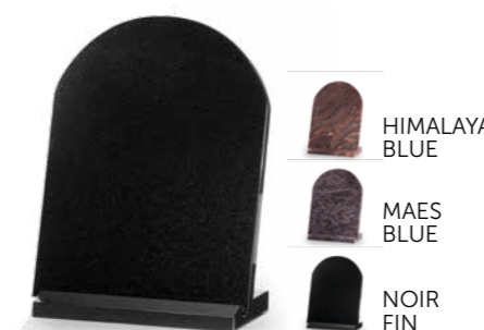
HIMALAYA BLUE MAES BLUE NOIR FIN