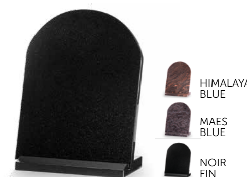
HIMALAYA BLUE MAES BLUE NOIR FIN