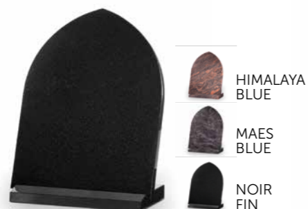
HIMALAYA BLUE MAES BLUE NOIR FIN