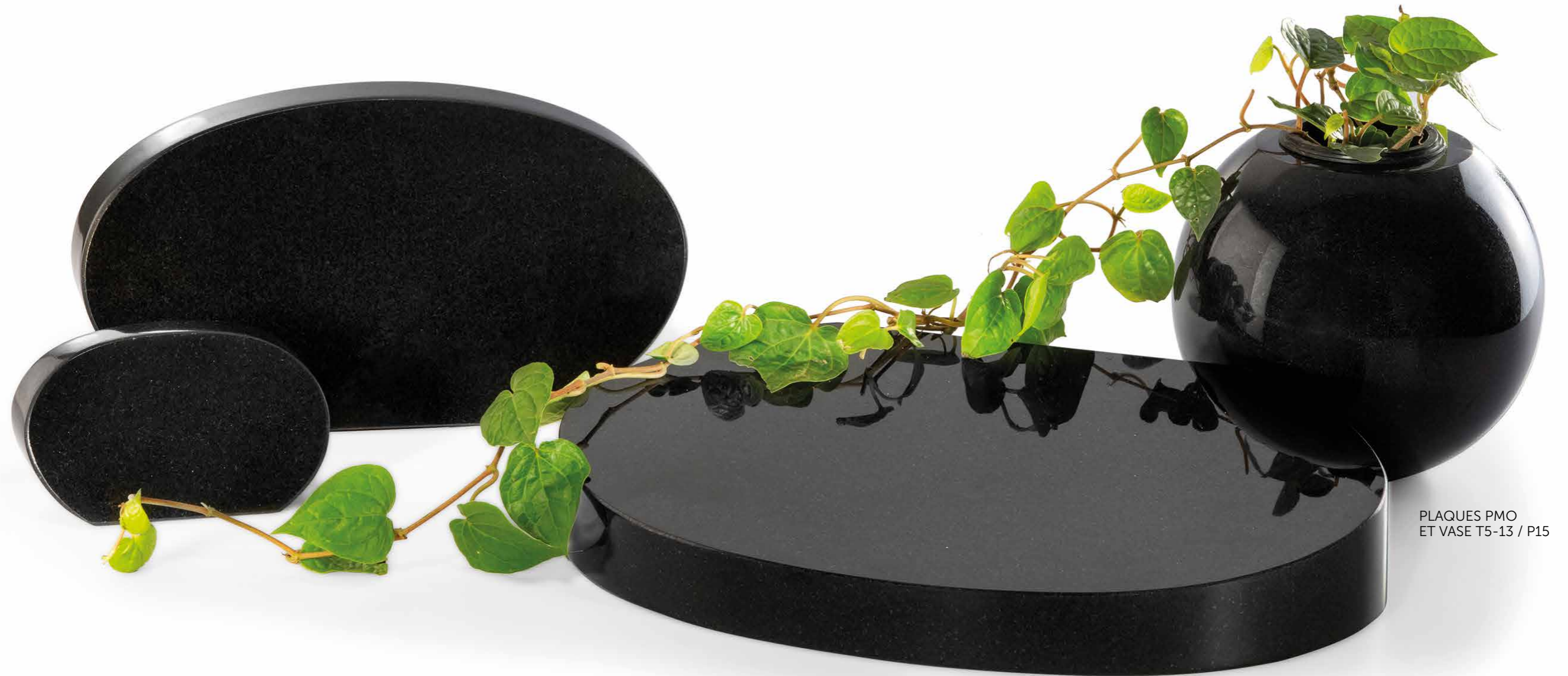
PLAQUES PMO ET VASE T5-13 / P15