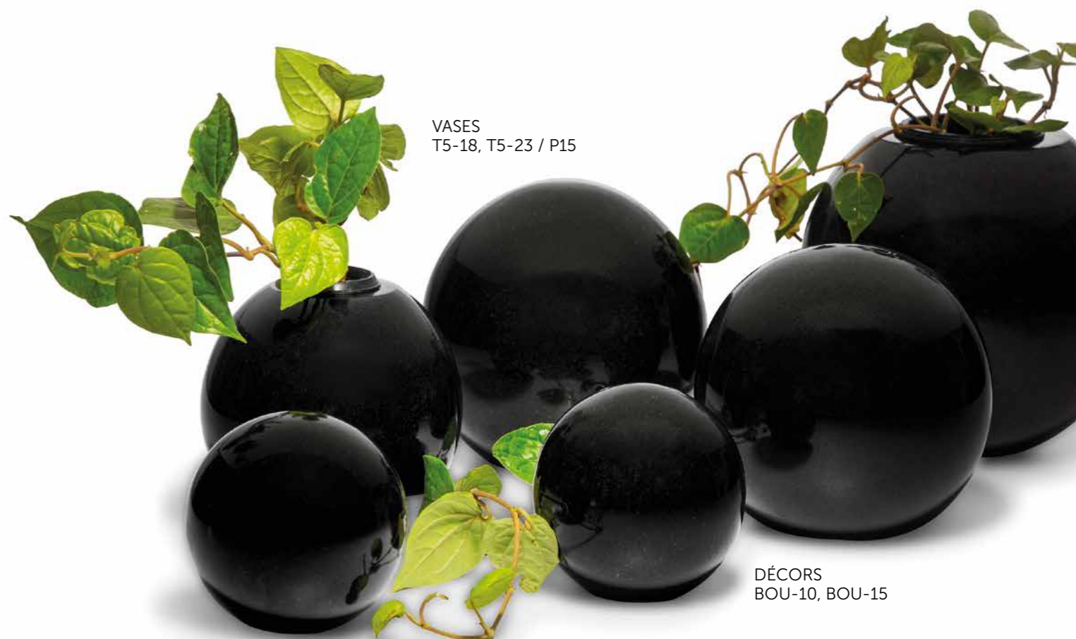
VASES T5-18, T5-23 / P15