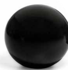
DÉCORS BOU-10, BOU-15